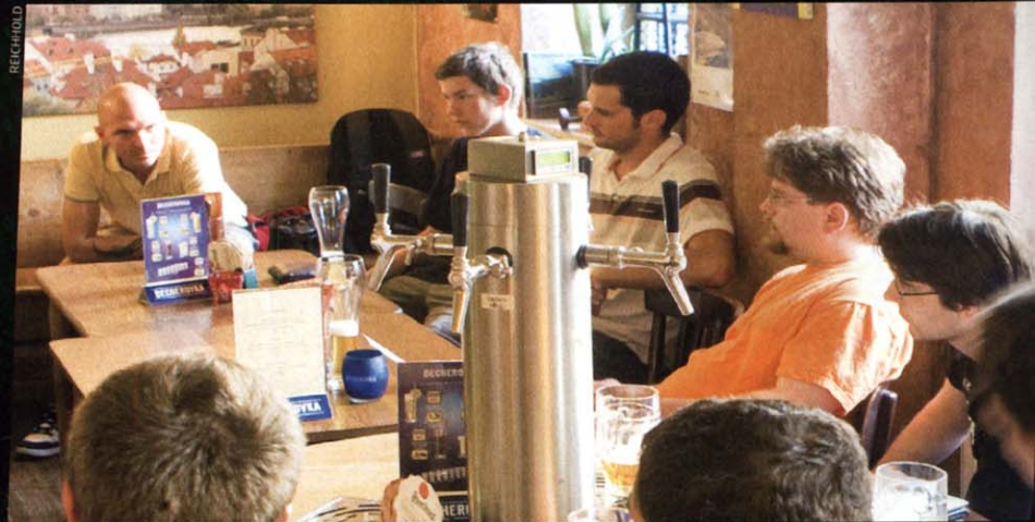
Du bist nicht allein: Leipziger Piraten bereiten die Gründung eines Ortsverbandes vor

0,9 Prozent. In Leipzig überzeugten die Piraten bei der Europawahl gar 1,7 Prozent der Wähler.