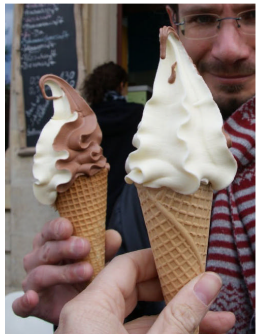
Ersteis und Zweiteis ☺

Mehr Informationen unter www.ob-winkler.com/gedichte Kontakt: michael_winkler@gmx.net , +49 (0) 351 8107099